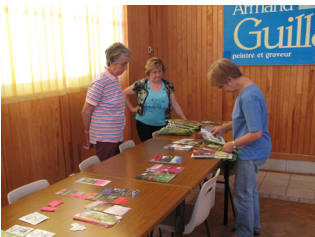
1- L'installation du matériel pour l'AG était le travail des gentils organisateurs

St-Yrieix - St-Pierre-hors-les-Murs [La Nouaille](unions 1678-1791, 1000) : 27 €