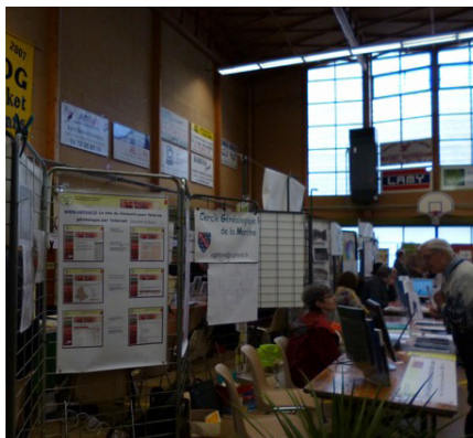
Photo du stand du CGHHML au 5e Forum des cercles rhône-alpins à Givors

consacrée aux échanges de quartiers et relevés, déjeuner au restaurant, où nous retrouverons les membres