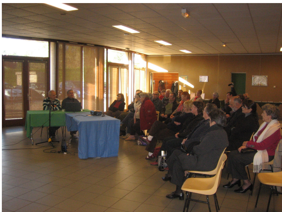
Photo de notre réunion au Châtenet-en-Dognon- 27 octobre 2012

Notre réunion de printemps aura lieu le samedi 16 mars 2013 : matinée